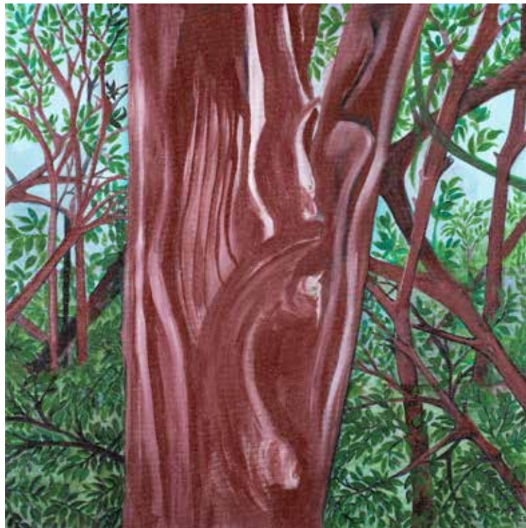
Bosque Detalhe 2/ 50 X 50 cm / Acrílico s/ tela / 2022