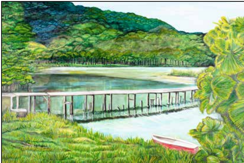
Ponte da Lagoa/ 80 X 120 cm / Acrílico s/ tela / 2022