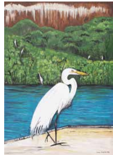
Garça Solitária / 70 X 50 cm / Acrílico s/ tela / 2022