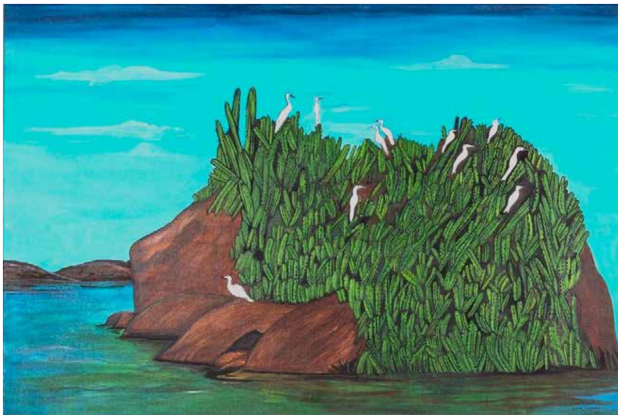
Garças do Pontal/ 80 X 120 cm / Acrílico s/ tela / 2022