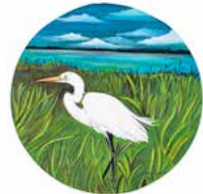
Garça Redonda / 20 X 20 cm / Acrílico s/ tela / 2022