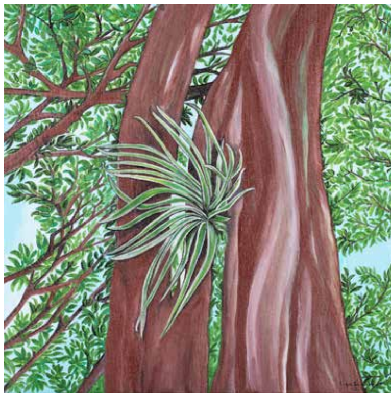
Bosque Detalhe 1/ 50 X 50 cm / Acrílico s/ tela / 2022